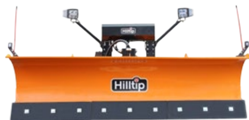
Orange SML-Schneepflug mit LED Scheinwerfern