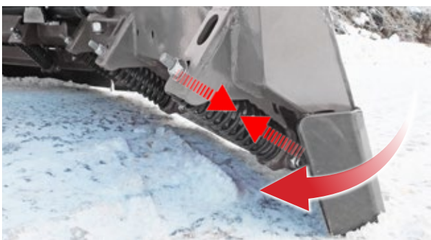
Schürfleiste mit Absorber-Federn