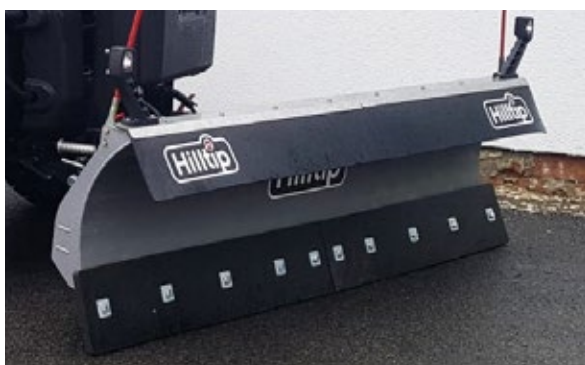
Poly-Schneeabweiser für Gerade-Pflug (optional)