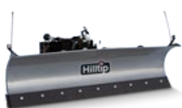
Gerader Pflug für LKW

Das gewölbte, pulverbeschichtete Schild ist aus robustem Stahl gefertigt, der in diesem Fall der Schlüssel zu unserem widerstandsfähigen und dennoch leichten Pflug ist. Die regulierbare Schürfleiste ist in Polyurethan oder Stahl erhältlich.