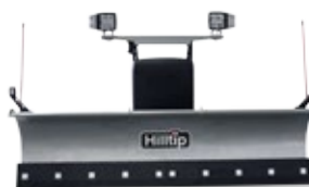
Gerader Pflug für Pickup