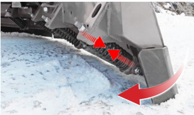
Schürfleiste mit Absorber-Federn